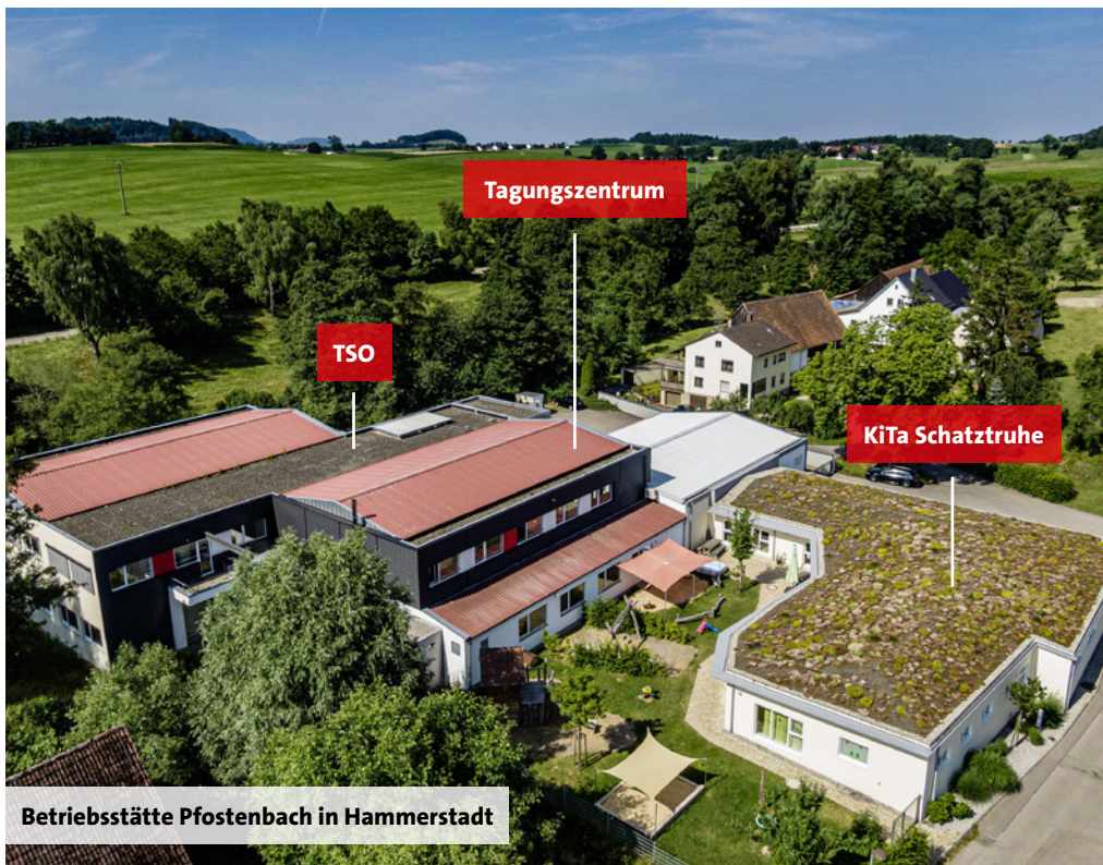
Betriebsstätte Pfostenbach in Hammerstadt

Wer wir sind, was Du bei uns und mit uns lernen und umsetzen kannst, das erfährst Du auf den folgenden Seiten. Vielleicht dürfen wir Dich schon bald als Teil unseres Teams begrüßen! Wir freuen uns auf dich!