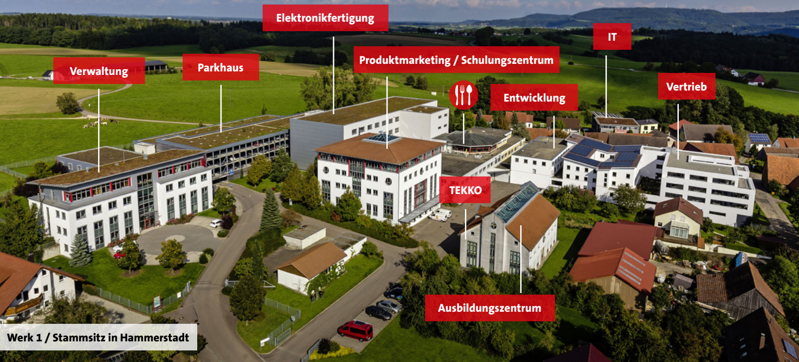
Werk 1 / Stammsitz in Hammerstadt