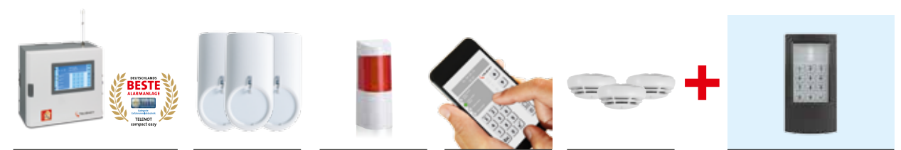
1 Zentrale „compact easy“ mit Touch-Bedienteil 3 Bewegungsmelder 1 Alarmsirene mit Blitzlicht 1 Alarmanlagen-App „BuildSec“ 3 Rauchwarnmelder 1 Zutrittskontrollleser

Das Alarmanlagen-Paket Akesso beinhaltet folgende Komponenten: