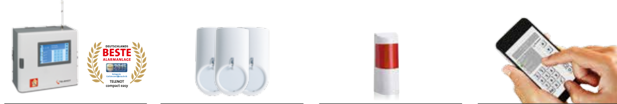
1 Zentrale „compact easy“ mit Touch-Bedienteil 3 Bewegungsmelder 1 Alarmsirene mit Blitzlicht 1 Alarmanlagen-App „BuildSec“

Das Alarmanlagen-Paket Aduko beinhaltet folgende Komponenten: