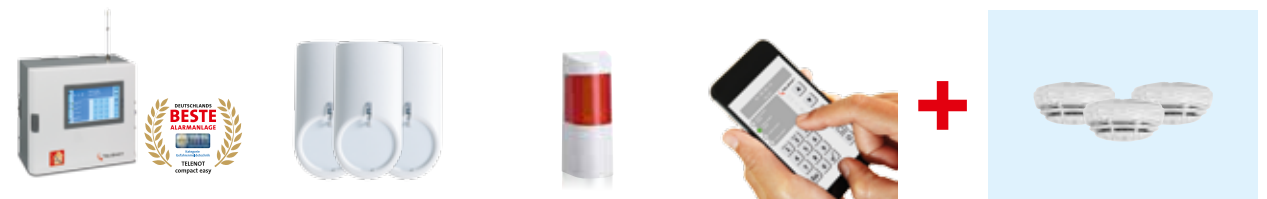
1 Zentrale „compact easy“ mit Touch-Bedienteil 3 Bewegungsmelder 1 Alarmsirene mit Blitzlicht 1 Alarmanlagen-App „BuildSec“ 3 Rauchwarnmelder

Das Alarmanlagen-Paket Arteo beinhaltet folgende Komponenten: